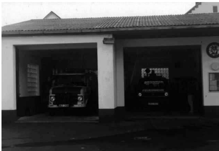
neues Gerätehaus in der Dietzhölzstraße und neues Löschgruppenfahrzeug (LF/8, Opel Blitz)