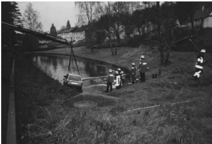
Bergung des PKW aus dem Brandweiher

geborgen werden. Personenschaden war glücklicherweise nicht zu melden. Nach diesem Einsatz diskutierte man in der Wehr die nicht ganz ernst gemeinte Frage „ Wann bekommen wir ein Rettungsboot? “, da dies in diesem Jahr der zweite Einsatz bei Unfällen in fließendem und stehendem Gewässer war.