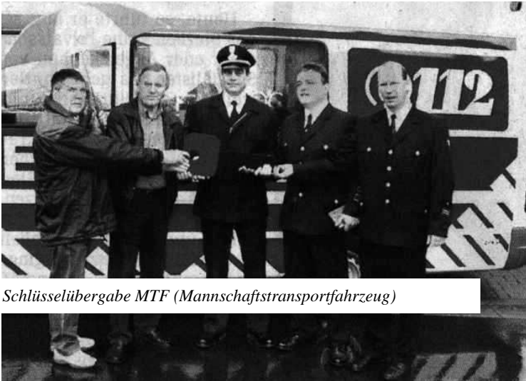
Schlüsselübergabe MTF (Mannschaftstransportfahrzeug)

Interessantes und Wissenswertes kann auf der Homepage der Feuerwehr Wissenbach unter www.feuerwehr-wissenbach.de nachgelesen werden.