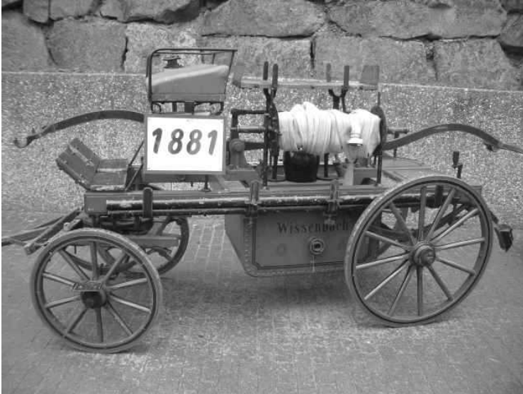
Saug- und Druckspritze von 1881

Mark 10 Pfg. und unter den Bedingungen wie solche in dem von dem vorgenannten Fabrikanten zugesandten Lieferzettel vom 7. angegeben sind, für die hiesige Gemeinde bestellt werden“.