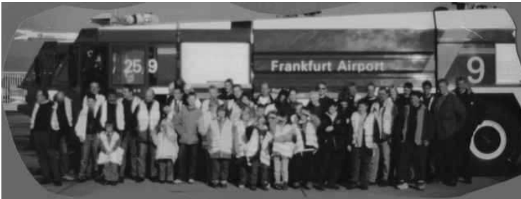
Ausflug zur Flughafenfeuerwehr Frankfurt

Nach vortrefflicher Organisation durch die Jugendfeuerwehr startete diese gemeinsam mit der Einsatzabteilung zu einem Tagesausflug an den „ Rhein-Main Airport “ nach Frankfurt. Nach der Besichtigung der Flughafenfeuerwehr erlebten wir imposante Eindrücke auf der Rundfahrt über das Flughafengelände. Abschließend führte uns ein Abstecher zur Außenstelle des Feuerwehrmuseum.