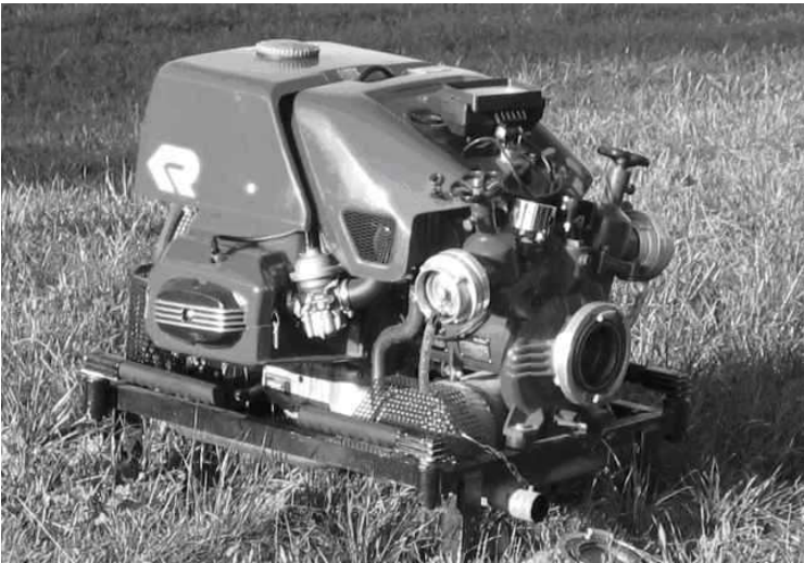
Tragradspritze (TS8/8) Typ „FOX“, Fa. Rosenbauer