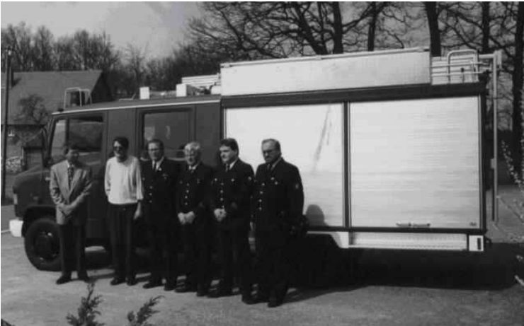
April 1992, Abholung des neuen Löschgruppenfahrzeuges (LF8/6) mit Zusatzbeladung „Gefahrgut“