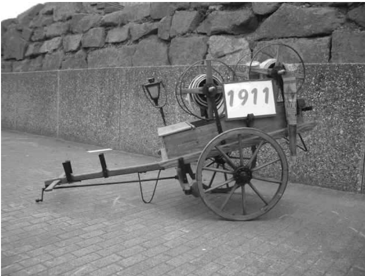
Schlauchwagen von 1911 (Hydrantenkarmchen)

Nach dieser Zeit sind wenig oder gar keine Aufzeichnungen vorhanden, meist nur Ausgaben für die Anschaffung von Geräten und Ausrüstungsgegenständen. Der größte Posten war der 1911 gekaufte Schlauchwagen, der ebenfalls heute noch in tadellosem Zustand im Besitz der Feuerwehr ist. Angaben über die Wehrführung und Spritzenmeister existieren nicht.